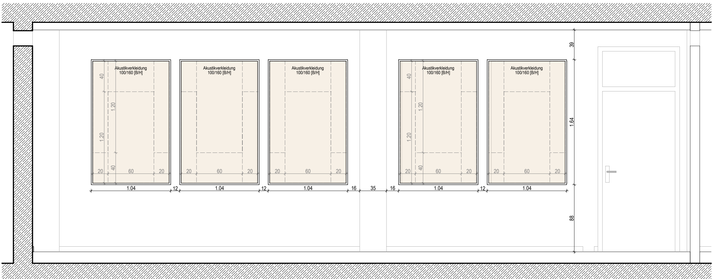
Wand 2 1:30

Plan zeigt die Wandansichten für einen exemplarischen Klassenraum. Höhe und Breite der Absorber sowie Zuschnitt sind in allen Klassenräumen gleich.